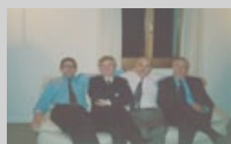
Lo staff del Gruppo Tecnoinformatica

ulteriormente le dimensioni del gruppo. Ma vediamo come si compone l'offerta delle singole società. Nel mercato dal 1981, Tinet è nel mercato locale 'un centro di competenza' riconosciuto per la fornitura e l'assistenza di infrastrutture hardware e sistemiche e la vendita e manutenzione di soluzioni di stampa digitale B/N e colore. In linea con le evoluzioni del mondo business, Tinet ha investito, e investe sempre più, risorse e competenze a favore di temi di importanza strategica quali, sicurezza; server consolidation e business continuity; document management e servizi di outsourcing. Innovativa per eccellenza, Sinesy supporta la competitività delle grandi corporates implementando soluzioni ad hoc e standardizzate di Crm, E-business, post vendita e business intelligence con l'impiego delle più moderne tecnologie informatiche: una mission dedicata a progetti web innovativi e all'integrazione di sistemi informatici per la gestione di business estesi. Consulenza IT, project management, e software development completano la gamma dei servizi offerti. Rean, azienda di punta per know-how e professionalità nell'ambito delle soluzioni gestionali per la pmi parla con i suoi stessi numeri oltre 900 le installazioni aziendali e più di 400 le installazioni presso gli studi commerciali e consulenti del lavoro. Uno staff