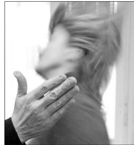
«Un ceffone per il suo bene...»