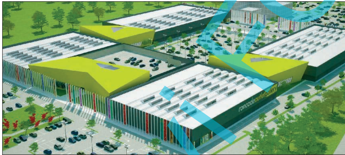
Il disegno tecnico rende un'immagine del mega outlet di Roncade con i suoi ottanta negozi, i ristoranti e i servizi di accoglienza

Il Consiglio di Stato ribalta la sentenza del Tar: via libera all'apertura del mega-outlet di Roncade